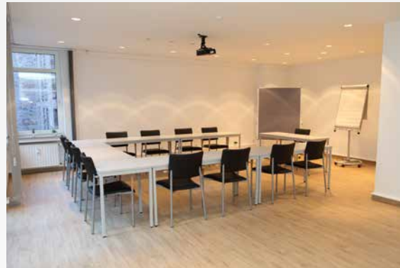
Raum „Altstadt“: 52m 2