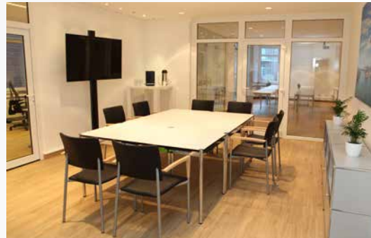
Raum „Oberkassel“: 26m 2