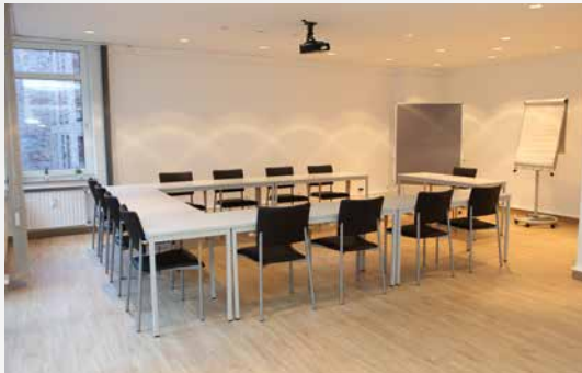
Raum „Altstadt“: 52m 2