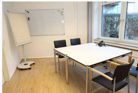
Raum „Kaiserswerth“: 13m 2