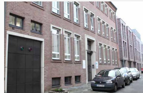
Gebäude von außen