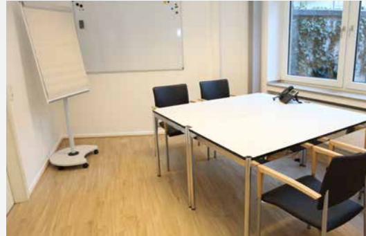
Raum „Kaiserswerth“: 13m 2