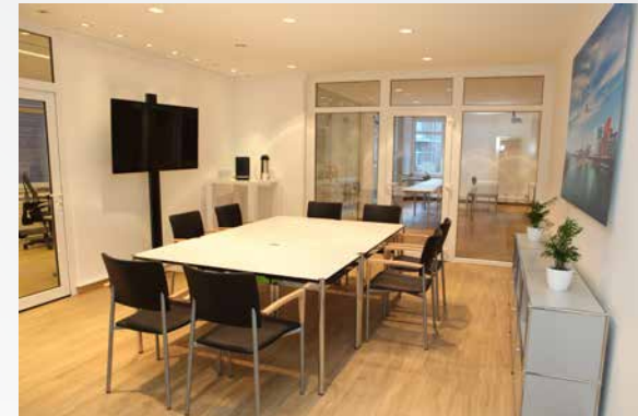
Raum „Oberkassel“: 26m 2