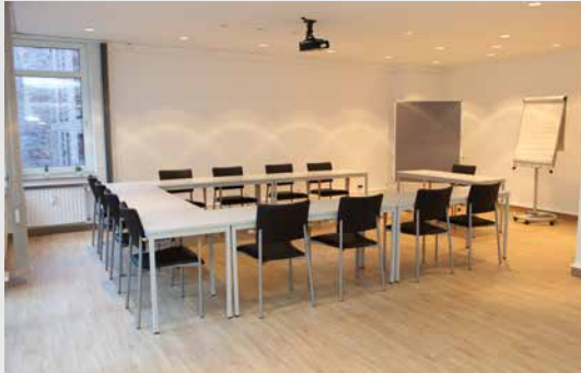
Raum „Altstadt“: 52m 2